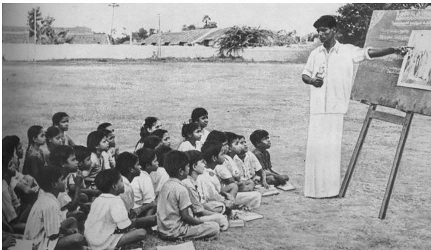
Mange av masteroppgåvene har tematikk med didaktisk relevans, særlig ved program knytt til lektorutdanning. Dei aller fleste av disse oppgåvene tar for seg norske tilhøve. Her frå katekismeundervising sør i India, 1939.

feltene som politisk, økonomisk, sosial- og idéhistorie. De plasserer seg heller innenfor flere felt og knytter sammen forskjellige metodiske tilnærminger. Dette gjenspeiler endringer i fagfeltet på både nasjonalt og internasjonalt nivå.