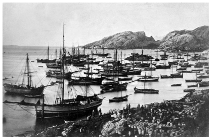
Mange av oppgavene ved Nord og UiT tar for seg nordnorske forhold. Her ved sildefiske i nærleiken av Bodø, ca. 1870.

Universitetet i Stavanger, NTNU og Høgskulen i Volda skreiv ikkje