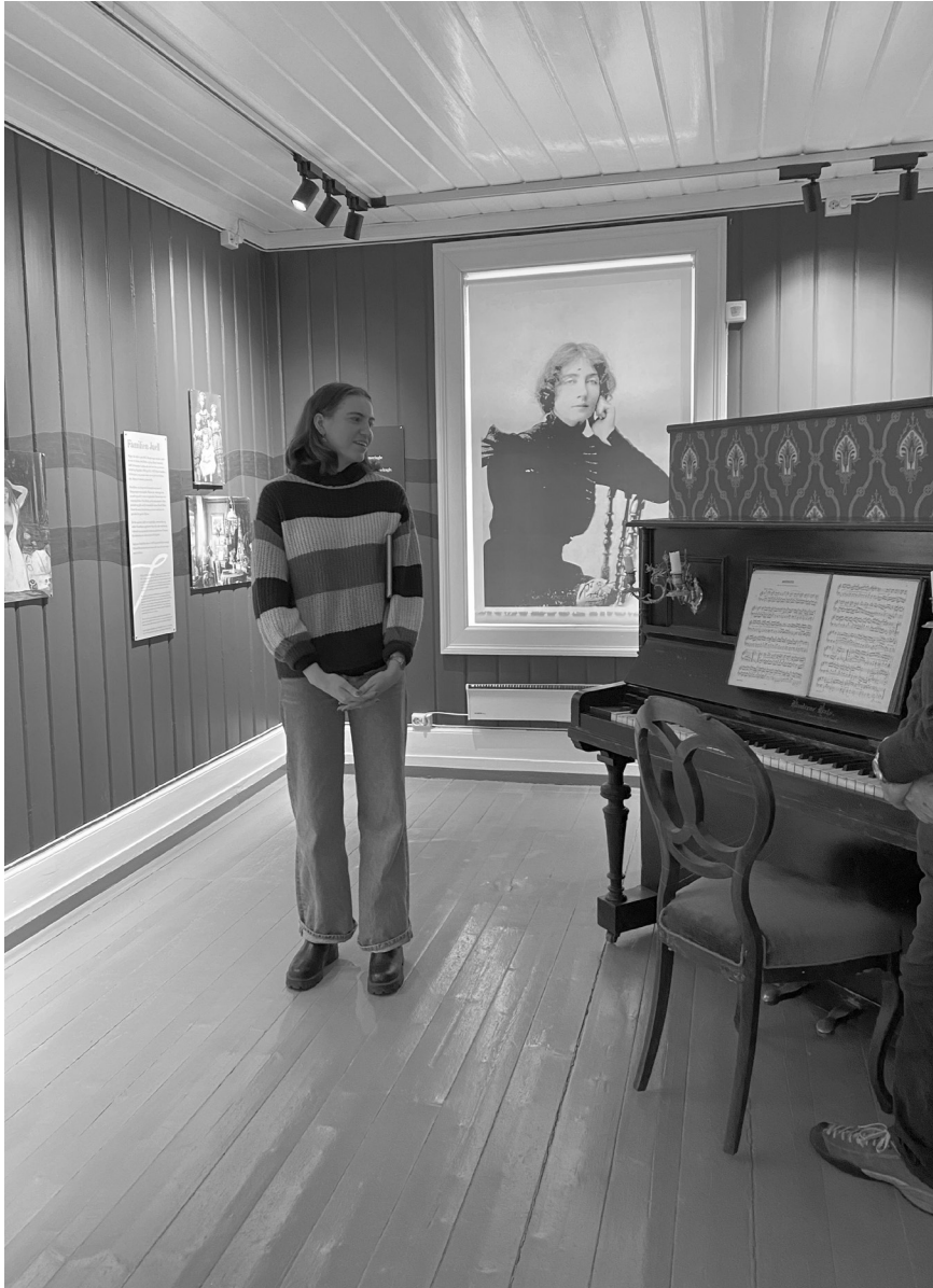
Fra Kvinnemuseet, Kongsvinger. Foto: Jonas Bertelsen Enge