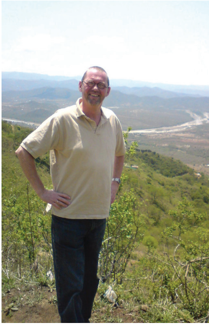
På misjonsmarka - Zululand.