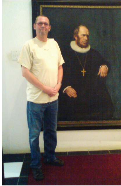
Framfor portrett av pionermisjonær Schröder i Zululand.

Storbritannia, slik som striden om fiskerigrensa.