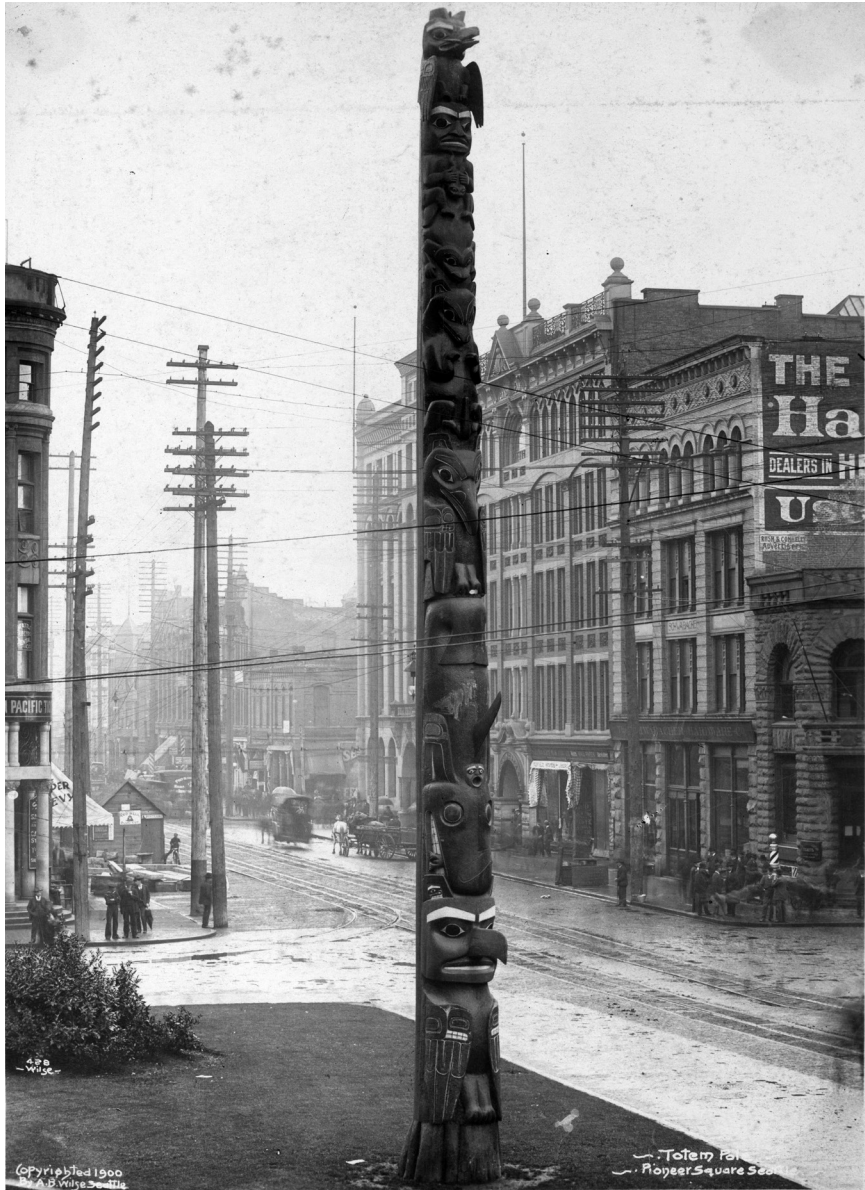
Totem Pole. Pioneer Square Seattle. 428. Anders Beer Wilse. 1900. Papirpositiv. 195x139mm. Nasjonalbiblioteket.