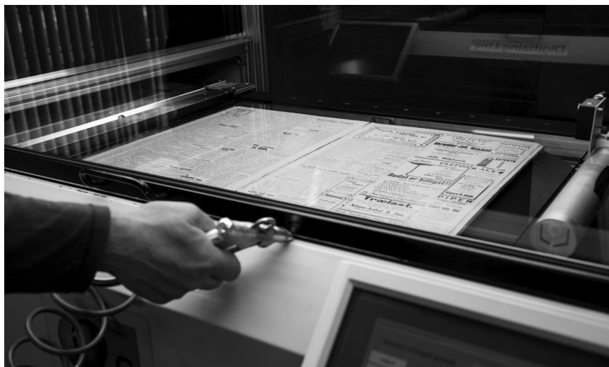
Tekst: Nasjonalbiblioteket er blitt «Norges riksmideiatek».

politisk-kulturelt minneparadigme», er en utvikling vi etter hvert tar for gitt. 10 De politiske implikasjonene og hvordan dette påvirker samfunnets infrastruktur – «infrapolitikken» – med et sentralt begrep hos Thulstrup, unnslipper i stor grad kritisk analyse. 11